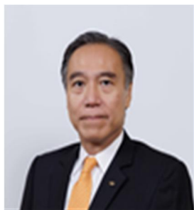
長野県知事 阿部守一