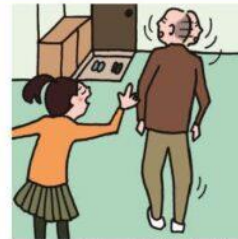
目を離せない家族の見守りや声かけなどの気づかいはしている