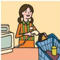
家計を支えるために労働をして、障がいや病気のある家族を助けている