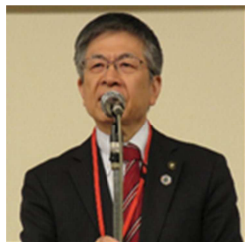
高知市長 岡崎誠也